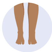
Stadium I: (spontan reversibel)