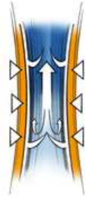
Vene unter Kompression