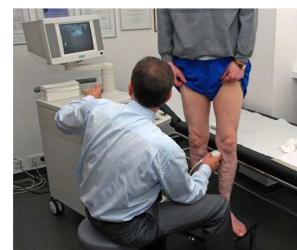
Duplexsonographie bei Krampfaderpatient