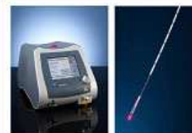
Abbildung 1: Laser generator und La serkatheter mit Pilotlicht