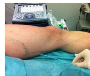
Abbildung 5: Laserkatheter in der Vena saphena accessoria superficialis