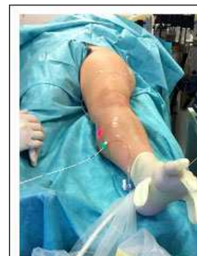
Abbildung 4: Laserkatheter in Unterschenkelperforansvene

Die Verwendung dieses schonenden Verfahrens auch für Perforansvenen und im Hautniveau gelegener varicöser Venen stellt eine Erweiterung des Spektrums dar. Die endovasculären Eingriffe können schnell, sicher, mittels Ultraschall jederzeit kontrollierbar und stets in einem ambulanten Setting mit geringer Belastung des Patienten durchgeführt werden. Die Versorgung mit Kompressionsstrümpfen ist postoperativ zu empfehlen.