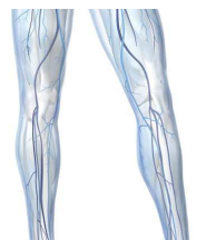
Zertifizierte CME-Fortbildung Phlebologie