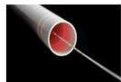
Abbildung 2: "ra diale Energie-abgabe